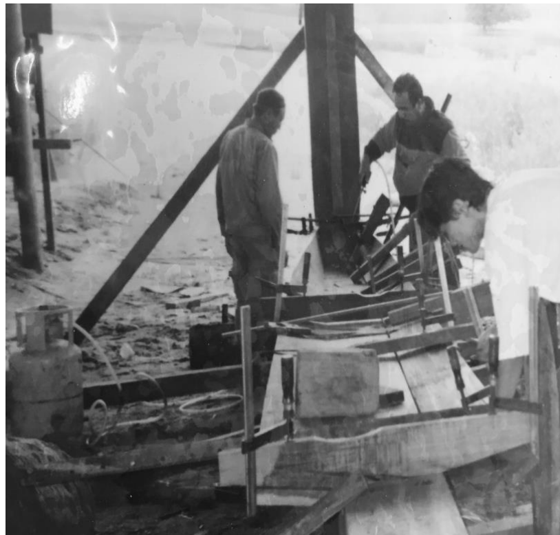
Gambar 4: Proses Mencipta Lunas di Bahagian Tengah Sebelum Proses Timbal Dilakukan