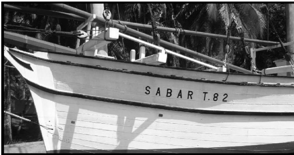
Gambar 8: Perahu Besar yang Digelar Sebagai Seri Telaga Sekitar 1925 53