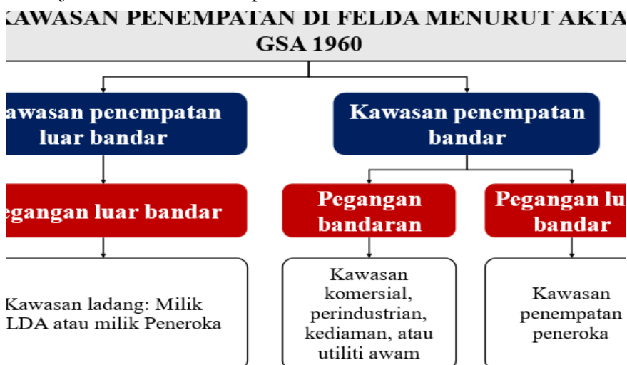
Rajah 2: Kawasan Penempatan di FELDA Menurut Akta GSA 1960

Dalam satu kawasan Rancangan FELDA, terdapat dua kategori penempatan: (1) kawasan penempatan luar bandar, dan (2) kawasan penempatan bandar. Menurut Akta Tanah (Penempatan Kawasan Berkelompok) 1960 (Akta GSA 1960), kawasan penempatan luar bandar ditakrifkan sebagai kawasan ladang Peneroka berdasarkan keterangan di subseksyen 5(2) dan subseksyen 25(2)(c) Akta GSA 1960. Kawasan penempatan luar bandar mempunyai sejenis pegangan sahaja, iaitu pegangan luar bandaran seperti yang dinyatakan dalam subseksyen 7(2). Kawasan penempatan bandar pula merupakan kawasan residen menurut seksyen 6, dengan dua jenis pegangan: (1) pegangan luar bandar, dan (2) pegangan bandaran seperti yang dinyatakan dalam subseksyen 7(2) dan 7(3). Kawasan penempatan bandar dengan pegangan luar bandaran adalah untuk kediaman komuniti Peneroka FELDA, manakala kawasan penempatan bandar dengan pegangan bandaran adalah digunakan untuk tujuan komersial, perindustrian, kediaman, atau utiliti awam. Ringkasnya, kawasan penempatan di FELDA menurut Akta GSA 1960 adalah seperti di rajah yang berikut: